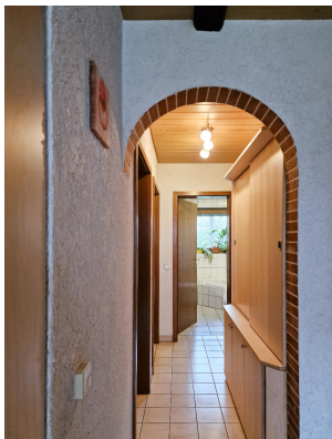
Gang zu Bad und Zimmer