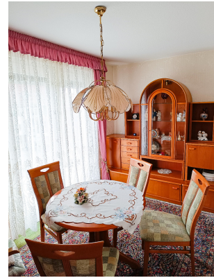
Esszimmer mit Zugang Terrasse