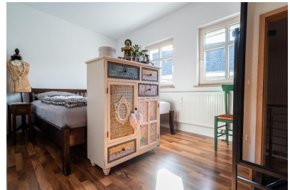
Wohnung 03 - Schlafen