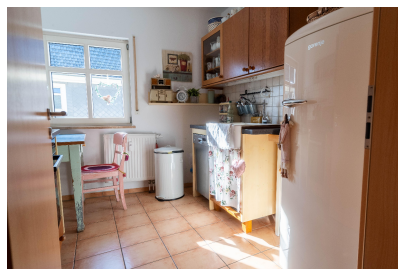
Wohnung 03 - Küche