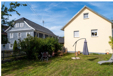
Wohnung 3 - Garten