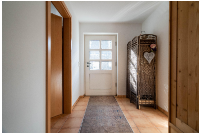
Wohnung 03 - Eingang