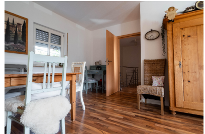
Wohnung 03 - Wohnen