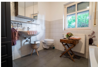
Wohnung 03 - Bad