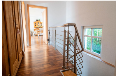
Wohnung 03 - Flur