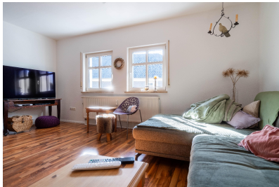
Wohnung 03 - Wohnen 01