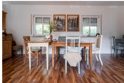
Wohnung 03 - Essen