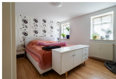
Wohnung 01 - Schlafen