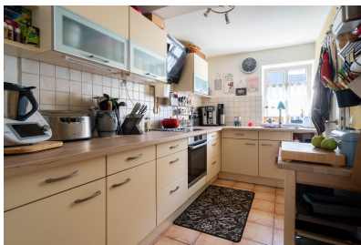
Wohnung 01 - Küche