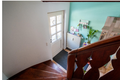
Wohnung 01 - Eingang