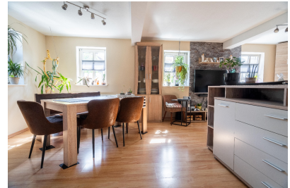
Wohnung 01 - Wohnen / Essen