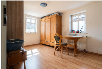
Wohnung 01 - Zimmer